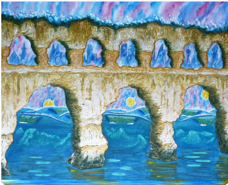
„Wave Mountains“, H 80 cm, B 100 cm, T 7 cm, Acryl auf Leinwand

Der Künstler ist Dozent für Malerei u. a. an den Volkshochschulen Sachsenwald, Aumühle und Schwarzenbek und absolvierte seine künstlerische Hochschulausbildung in Hamburg. In der Hansestadt gestaltete er an den großen Theatern wie der Staatsoper und dem Schauspielhaus Bühnenbilder. Plastiken von ihm können in einem Skulpturengarten im Herzen des Möllner Wildparks betrachtet werden.